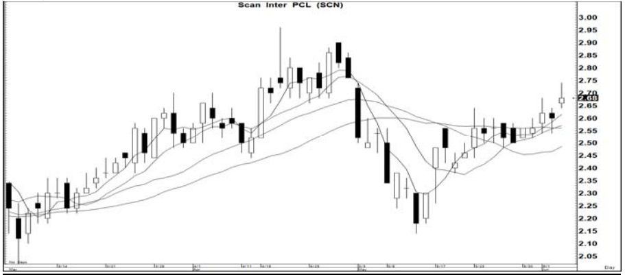
กราฟทางเทคนิคหุ้น SCN ราคาปิดเมื่อวาน 2.68 บาท Share price, Bt (RHS)

SCN (2.68 บาท) สัญญาณ: ชี้อ เครื่องชี้: ด แนะนำ: เก็งกำไรเร็ว ความเห็น: แรงเหวี่ยง 2.84; ให้ ขายตัดขาดทุนหาก ราคาต่ำกว่า 2.62