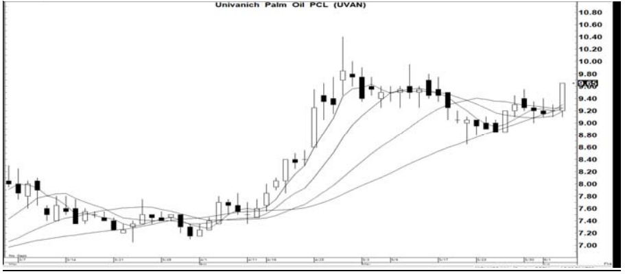
กราฟทางเทคนิคหุ้น UVAN ราคาปิดเมื่อวาน 9.65 บาท Share price, Bt (RHS)

UVAN (9.65 บาท) สัญญาณ: ชี้อ เครื่องชี้: ดี แนะนำ: เก็งกำไรเร็ว ความเห็น: แรงเหวี่ยง 10.10; ให้ ขายตัดขาดทุนหาก ราคาต่ำกว่า 9.40